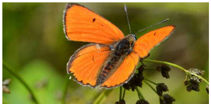
Cuivré des marais

Pour la Faune, le Cuivré des marais ( Lycaena dispar ), un papillon protégé, qui était inconnu dans la commune, a été découvert. Quelques espèces d'oiseaux, comme l'Alouette lulu ( Lullula arborea ) et le Martin pêcheur ( Alcedo atthis ), ou de reptiles, comme la Couleuvre vipérine ( Natrix maura ), sont venues enrichir le nombre d'espèces rares et/ou protégées recensées.