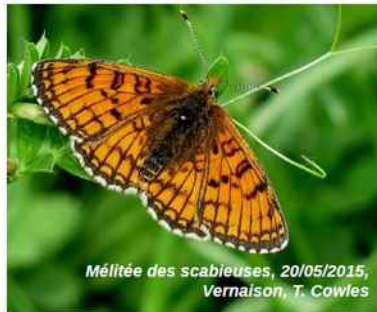
Mélitée des scabiéuses, 20/05/2015, Vernaizon, T. Cowles

Ces études constituent une base solide, mais sont loin de refléter la richesse du département. Peu de données ont été recueillies depuis 1960 et le territoire prospecté s'est limité pour l'essentiel à l'Agglomération lyonnaise, aux Monts d'Or et à l'Ouest Lyonnais.