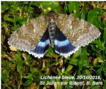
Lichénée bleue, 20/10/2016, St Julien sur Bilast, B. Barc

P lus de 2500 espèces de lépidoptères volent dans le département du Rhône et la Métropole. Un catalogue partiel en avait été dressé par Régis Mouterde et Claude Dufay entre 1950 et