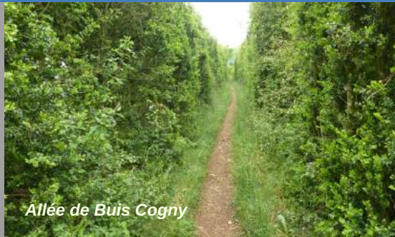
Allée de Buis Cogny