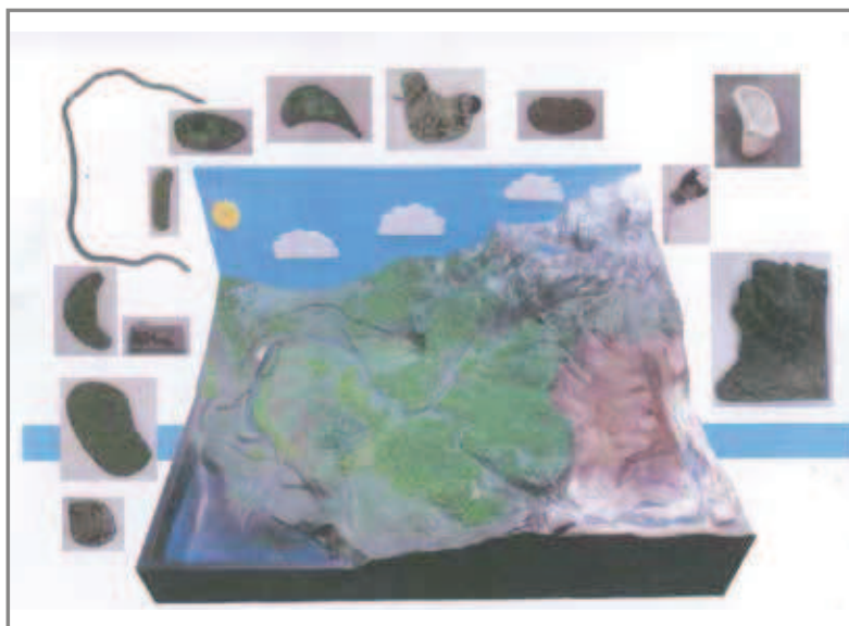
Le cycle de l'eau naturel

La conception et la fabrication de cet outil est le résultat d'une étroite collaboration entre le prestataire et le salarié FRAPNA. Au cours de l'élaboration, il s'est avéré nécessaire de modifier le cahier des charges notamment en terme de matériaux afin d'obtenir un résultat opérationnel et pérenne.