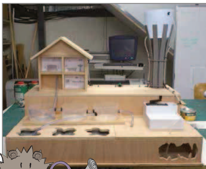
Le circuit de l'eau domestique