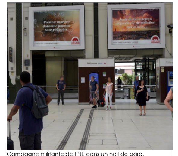
Campagne militante de FNE dans un hall de gare.