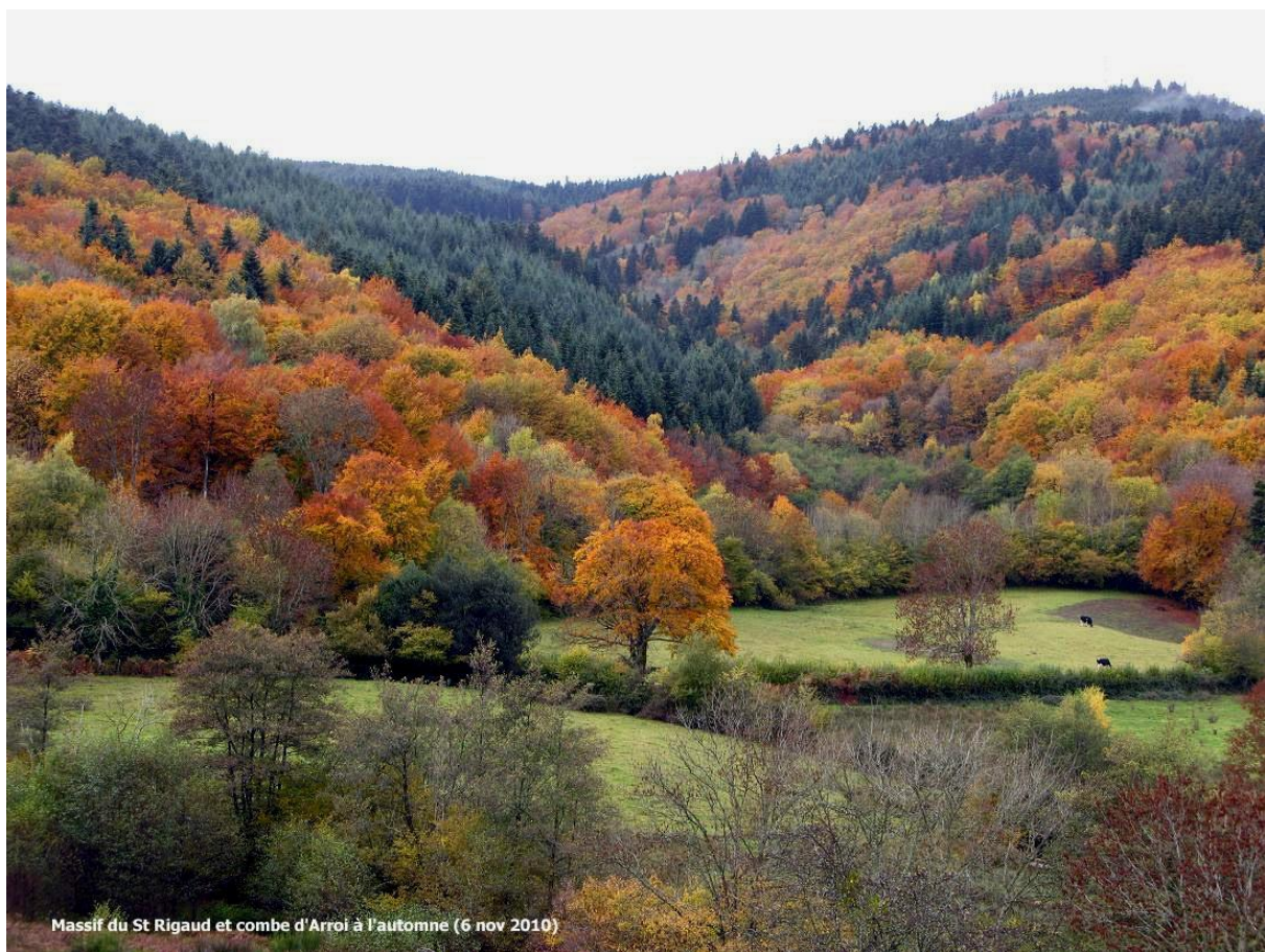
Massif du Saint-Rigaud. Forêt en cours d'acquisition par la FRAPNA-Rhône