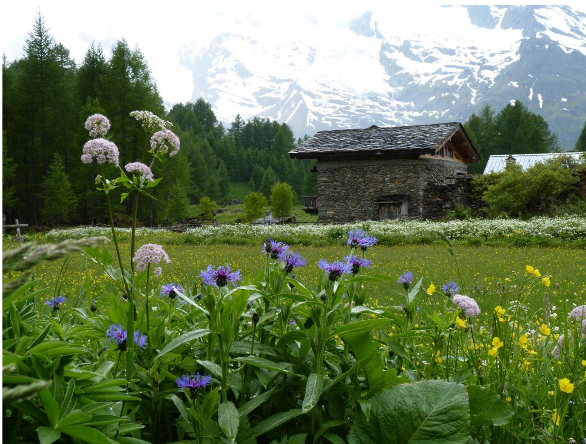
Hameau du Monal, face aux glaciers de La Gurráz