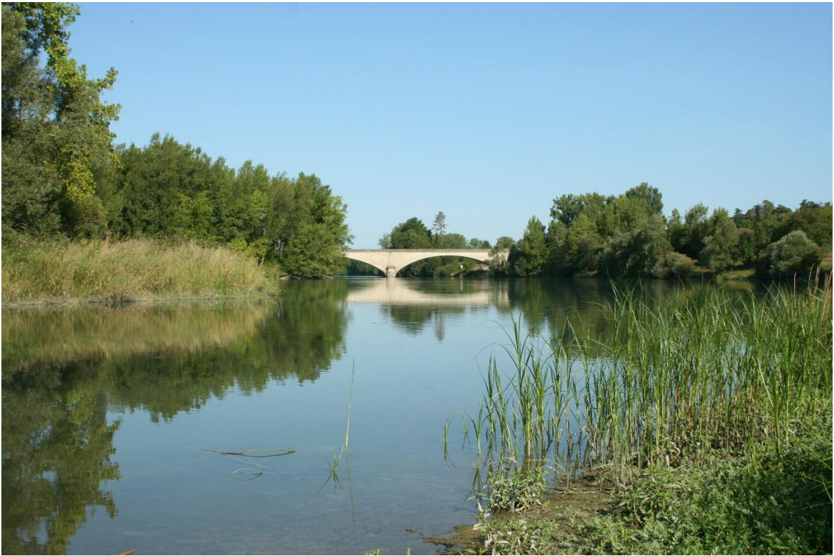
Réserve naturelle nationale des îles du Haut-Rhône