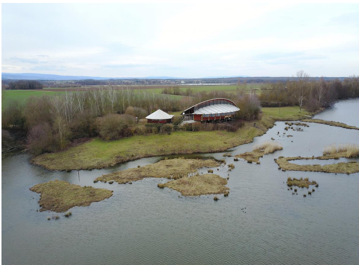
Ecopôle du Forez