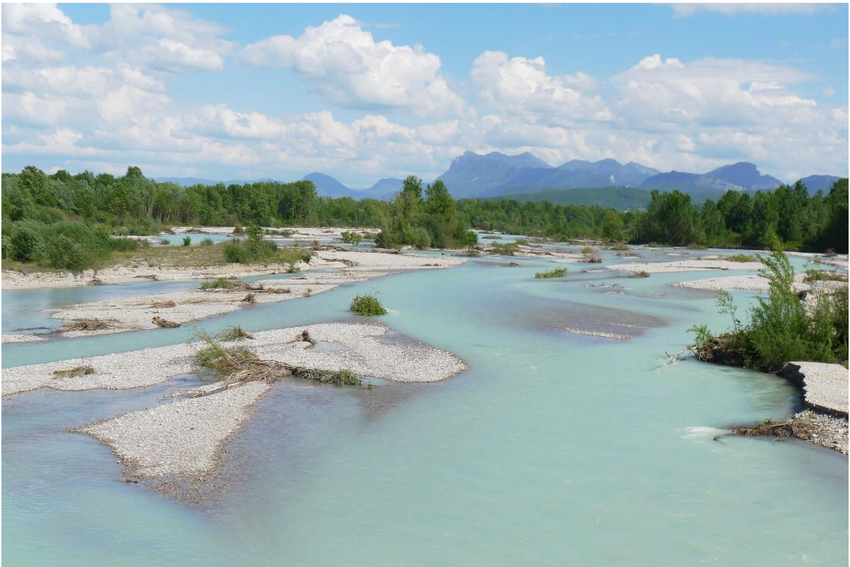
Réserve Naturelle Nationale des Ramières