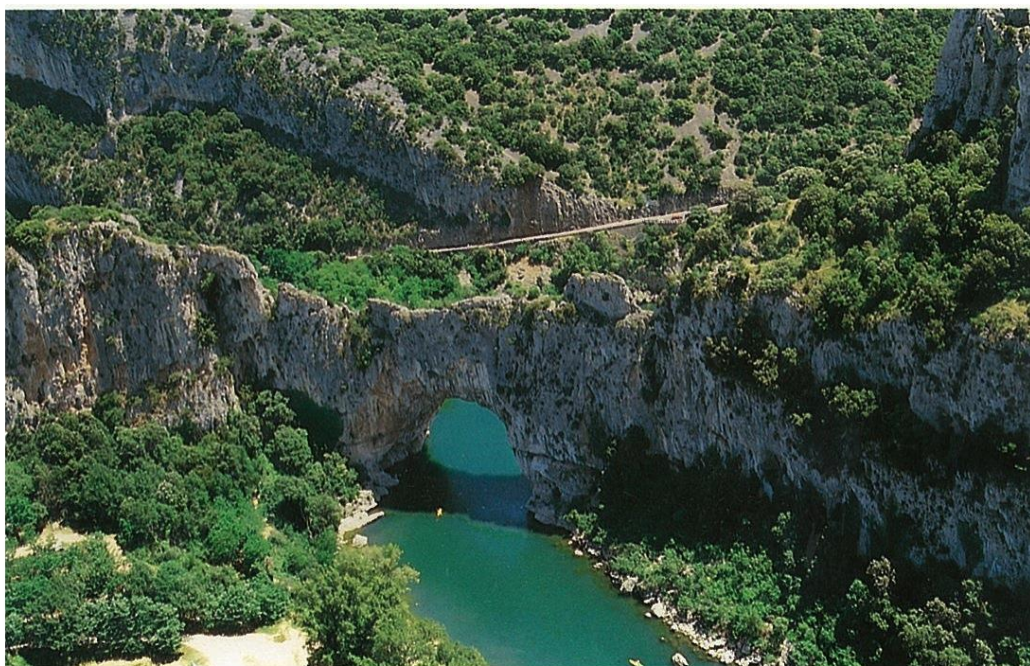
Réserve naturelle des Gorges de l'Ardèche (Le Pont d'Arc)