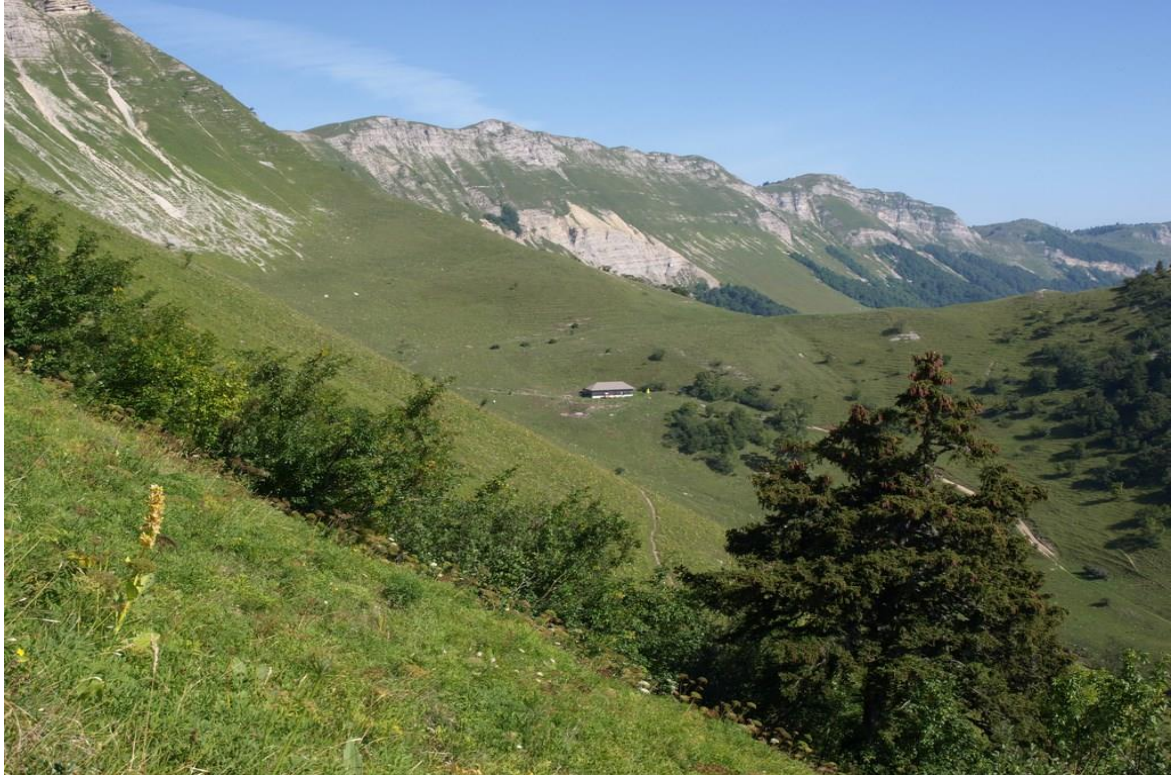
Réserve Naturelle de la Haute Chaîne du Jura