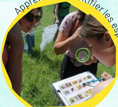
Apprendre à identifier les espèces