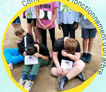
Comprendre le fonctionnement d'un arbre