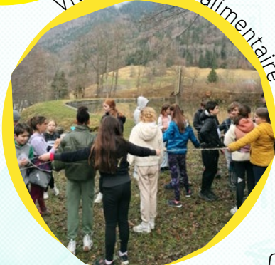
Vivre la chaîne alimentaire