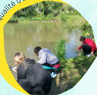
Déterminer la qualité d'une rivière