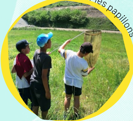
Identifier les papillons