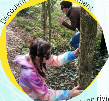
Découvrir la nature autrement