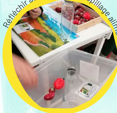
Réfléchir aux enjeux du gaspillage alimentaire