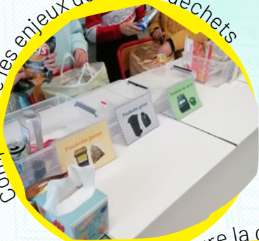
Comprendre les enjeux du tri des déchets