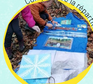
Comprendre la répartition de l'eau