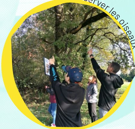
Observer les oiseaux