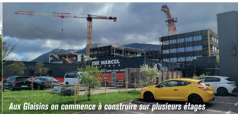
Aux Glaisins on commence à construire sur plusieurs étages

En construisant sur plusieurs étages, il serait possible de disposer de beaucoup plus de surfaces pour les activités industrielles et tertiaires !