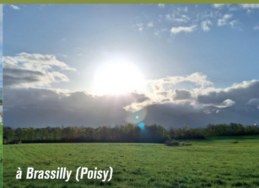
à Brassilly (Poisy)