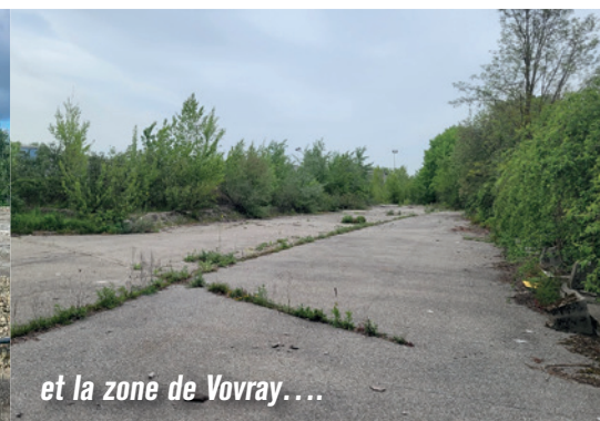
et la zone de Vovray...