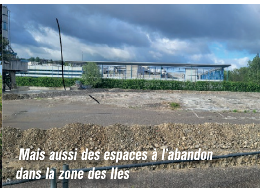
Mais aussi des espaces à l'abandon dans la zone des Iles