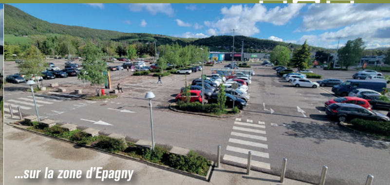
...sur la zone d'Epagny

Il est tout à fait possible de donner un avenir à l'industrie et à l'artisanat dans le Grand Anancy en optimisant les 770 hectares de zones d'activités existantes.