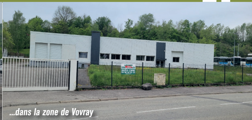
...dans la zone de Vovray