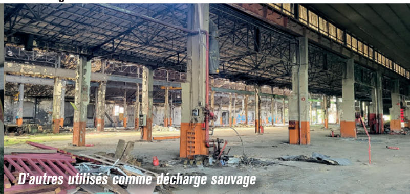
D'autres utilisés comme décharge sauvage