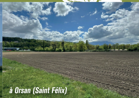
à Orsan (Saint Félix)