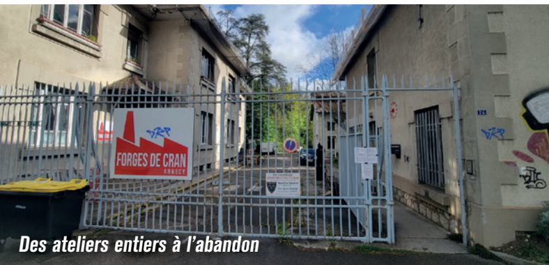
Des ateliers entiers à l'abandon

8 hectares à réhabiliter aux Forges de Cran