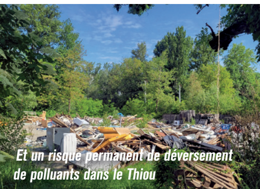
Et un risque permanent de déversement de polluants dans le Thiou