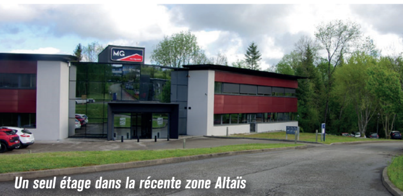
Un seul étage dans la récente zone Altaïs